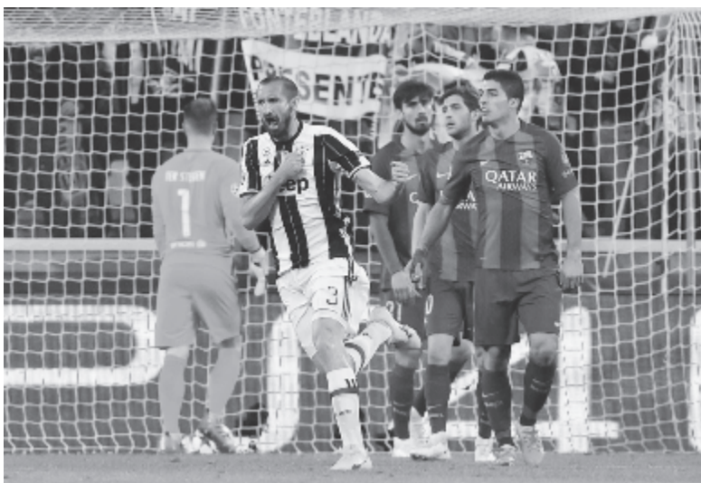
Giorgio Chiellini egy szöglet után megszerezte az olasz csapat harmadik gólját.

A másik keddre tervezett mérkőzést szerdára halasztották, ugyanis