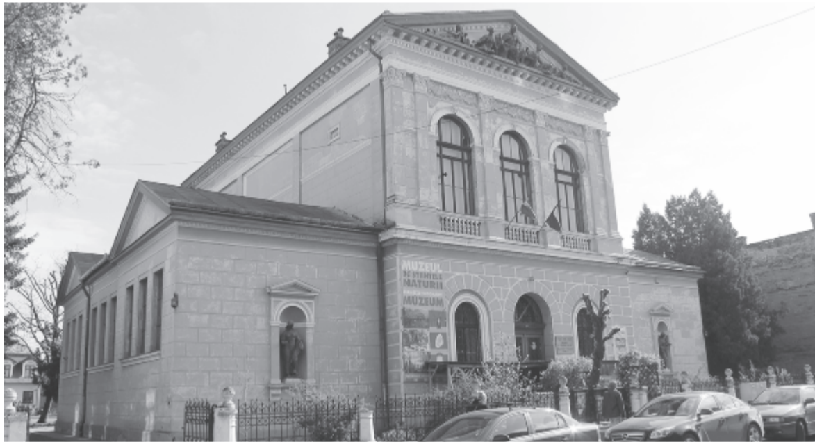
A Természettudományi Múzeum