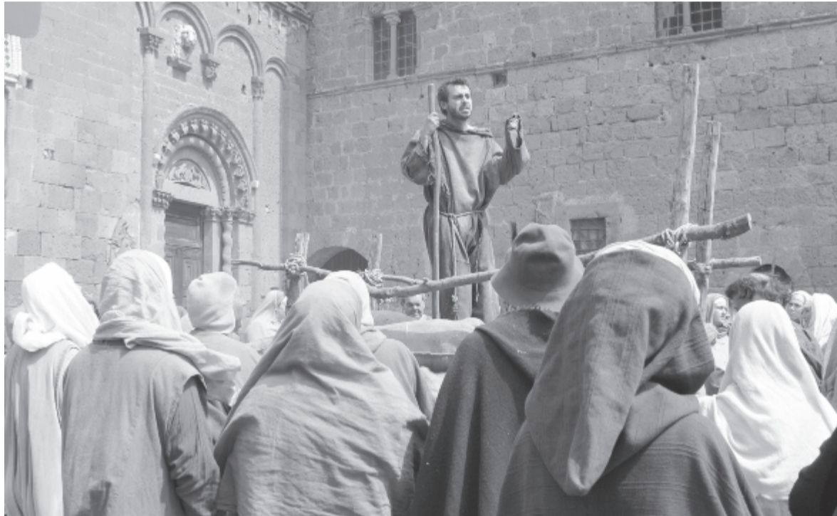
Páduai Szent Antal