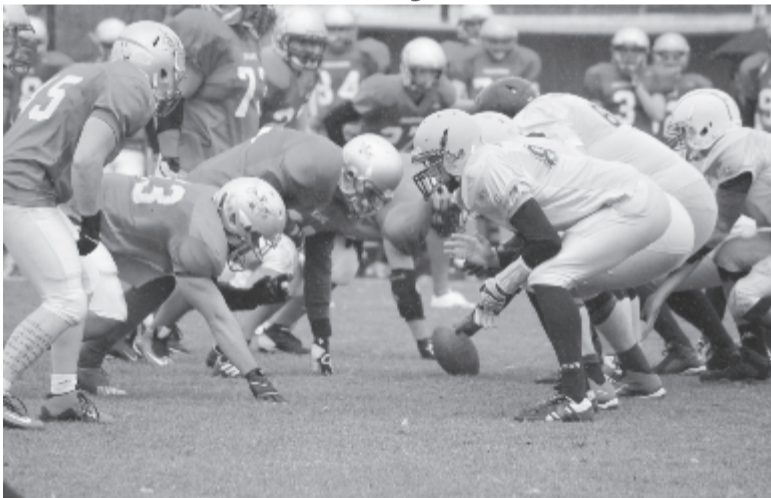
A sárga mezés marosvásárhelyi csapat számára gyakorlatilag most már csak egyetlen esély maradt a rájátszásba jutásra.

A második félidő is temesvári céllal és az ezt követő jutalomrúgással rajtolt, ám ezt követően fel-